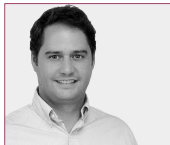
Ignacio Vázquez Casavilla Álcalde