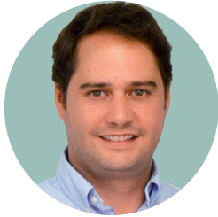
Ignacio Vázquez Casavilla Alcalde