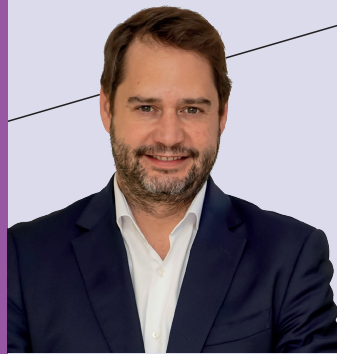
IGNACIO VÁZQUEZ CASAVILLA Alcalde de Torrejón de Ardoz