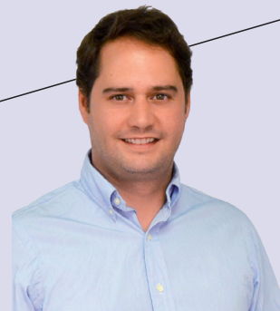
IGNACIO VÁZQUEZ CASAVILLA Alcalde de Torrejón de Ardoz

La conciliación de la vida laboral y personal consiste en la posibilidad de que las personas trabajadoras hagan compatibles, por un lado, la faceta laboral y por el otro, la personal en el sentido más amplio posible, incluyendo tanto las necesidades familiares como las personales e individuales, la gestión del ocio, etc.