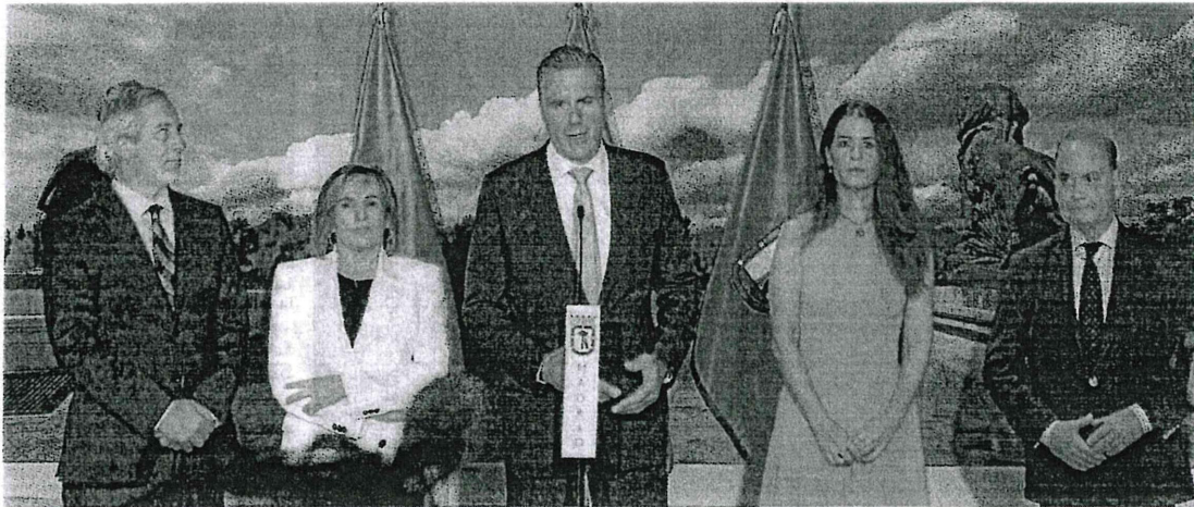
El equipo municipal de Vox el Ayuntamiento de Madrid